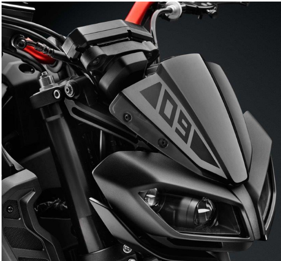
Windschild, Typ ZYF032