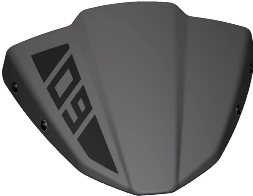
Windschild, Typ ZYF032